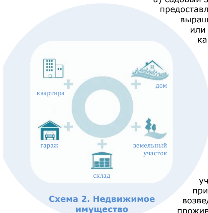
Схема 2. Недвижимое имущество